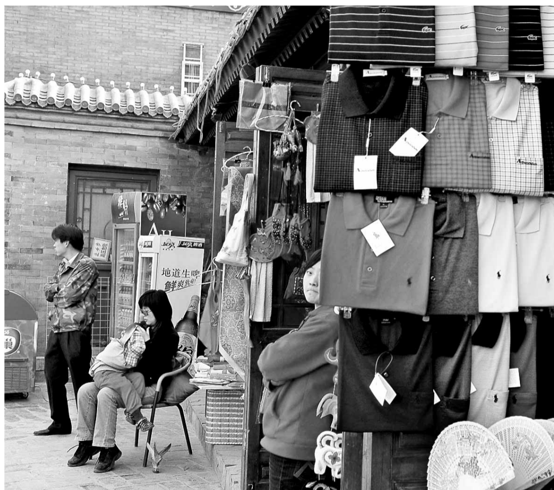
Made in China: Lacoste-Hemden dürften auch in diesem Fall ohne Genehmigung des Markenbesitzers gefertigt worden sein

„Vor zehn Jahren sah das noch anders aus, da arbeiteten die verantwortlichen Behörden und Ermittler kaum mit uns zusammen.“